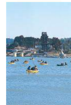
市原湖畔美術館(高滝湖)