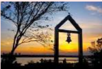
印旛沼サンセットヒルズ