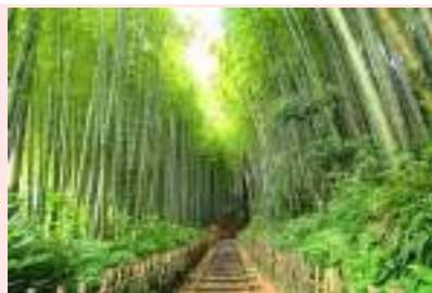
サムライの小径、ひよどり坂