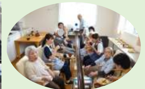
真ん中はレール? 「各駅停車にしてえ」流しそうめんの麺が通過してしまうから。