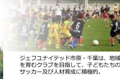
ジェフユナイテッド市原・千葉は、地域を育むクラブを目指して、子どもたちのサッカー及び人材育成に積極的。