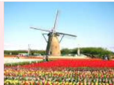
オランダ風車と四季折々の花

日本の玄関口「成田国際空港」から程近い佐倉市。佐倉藩の城下町として栄え、市内には佐倉城跡や武家屋敷が現存し、国立歴史人権博物館などを有する文化都市。佐倉順天堂を中心に蘭学の先進地にあり、「西の長崎、東の佐倉」と呼ばれた西洋医学の街でもあります。