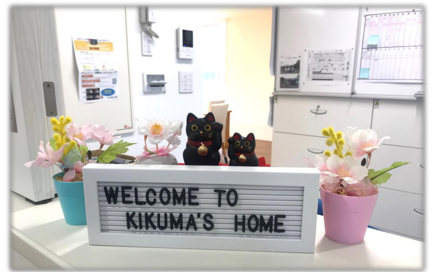
ようこそ、グループホームきくまの家へ!! オープンから半年が経ちました～

いつまで続くのか分からないコロナ禍ですが、そろそろ転禍為福(てんかいふく：災い転じて福と為す)の時期かもしれません。すでにマウントバードでは、今年の4月に市原市にグループホームきくまの家をオープン。佐倉市西志津のグループホームさくらの家は令和3年の開所に向けて、この8月19日(水)に地鎮祭を挙行了しました。新天地となる市原市、佐倉市は、どんなところでしょうか？介護のニーズはあるのでしょうか？市場調査してみました。ワンデイトリップ(日帰り旅行)感覚で楽しみながら、情報の一環としてお役立てください。