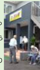
これから防火訓練ですよ

グループホームきくまの家は、居室数18と小規模な作りで家庭的な温かみのあるホームです。オープンから半年が経った今、すでに利用者の皆様は“我が家”のように馴染んで日々、過ごしていらっしゃいます。流しそうめんやかき氷を楽しんだりとっても和やか♪「秋のお楽しみは何かな〜♡」