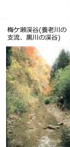
梅ヶ瀬渓谷(養老川の支流、黒川の渓谷)