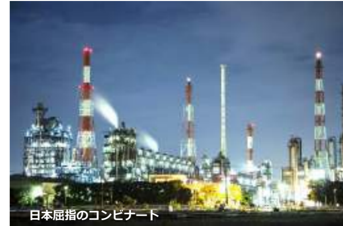
日本屈指のコンビナート

【総括】日本屈指のコンビナートがあり、優良なゴルフ場を所有し、新興住宅地であるため、年間29億円の黒字収益で、市原市は豊かな街です。