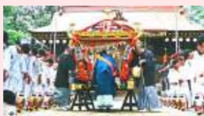
麻賀多神社の祭礼