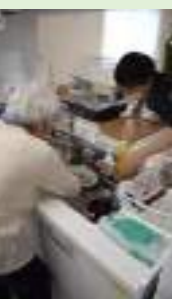
自立支援：自分のことは自分で...