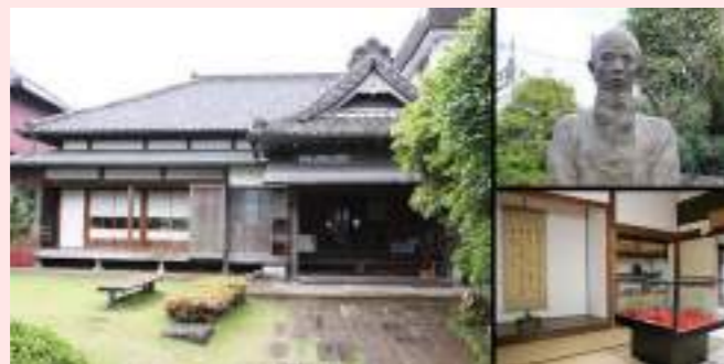
佐倉順天堂記念館と佐藤泰然像