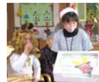
ほ~ら、X'masケーキです。でも、午後のお楽しみ! 待っててくださいね♡