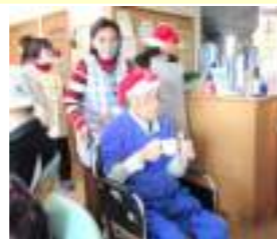
ご老公の入場です~