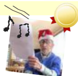
X'masソングにコブシ効かせてます