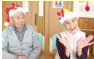
皆を幸せにする満面の笑み♡♡