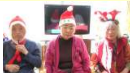
YouTuber? 絵になるトリオです♡