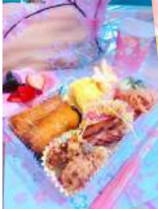
手作りのお花見弁当

デザートは森田農園の苺と桜餅。ホーム長自ら津田沼(船橋市前原)の森田農園から甘くて美味しい苺を仕入れてくれます。