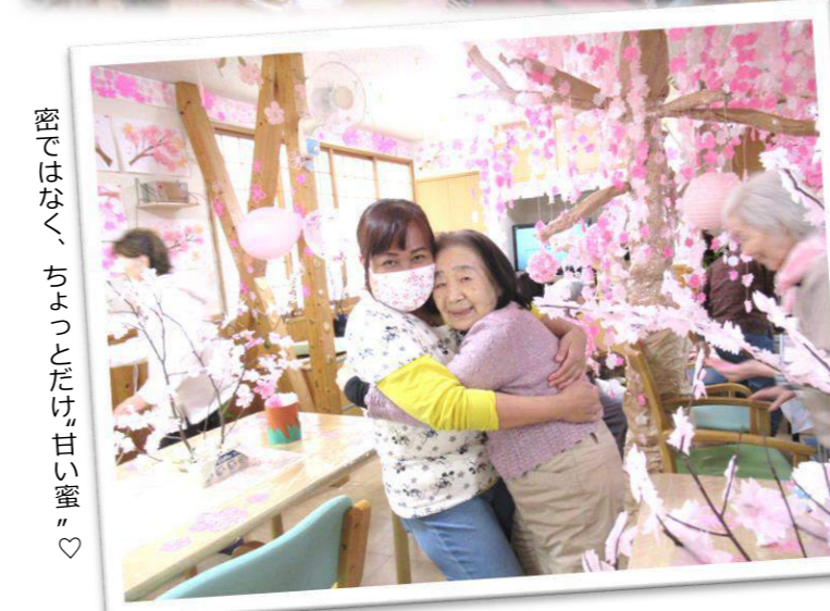
密ではなく、ちよつとだけ、甘い蜜♡