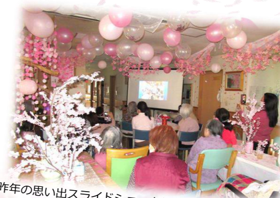
昨年の思い出スライドショーを見てお開きになりました。

デザートは森田農園の苺と桜餅。ホーム長自ら津田沼(船橋市前原)の森田農園から甘くて美味しい苺を仕入れてくれます。