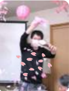
花咲か兄さん? (庄子管理者)