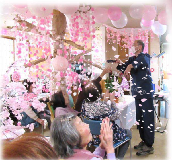
「やっと出番だ~」こちらは張り切る花咲かおじさん?