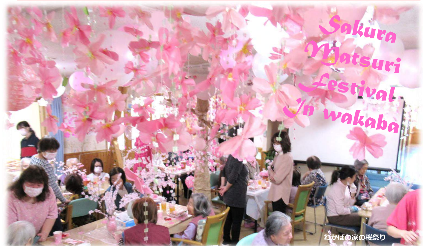
わかばの家の桜祭り