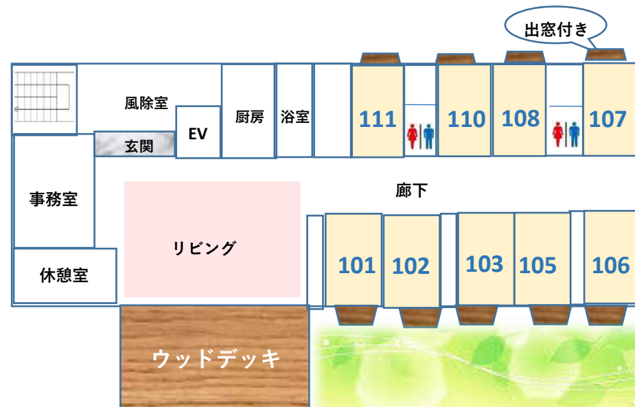
木のぬくもりがあふれるリビング