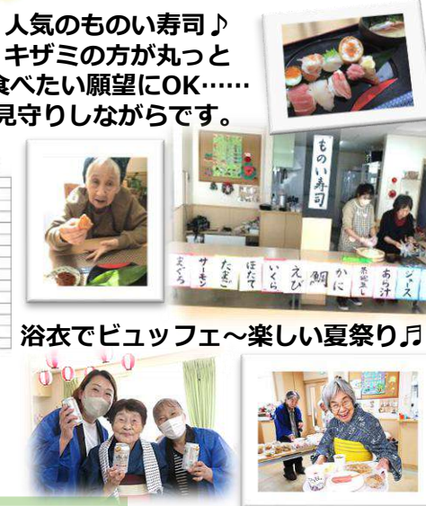
浴衣でビュッフェ～楽しい夏祭り♪

人気のものい寿司♪ キザミの方が丸っと 食べたい願望にOK…… 見守りしながらです。